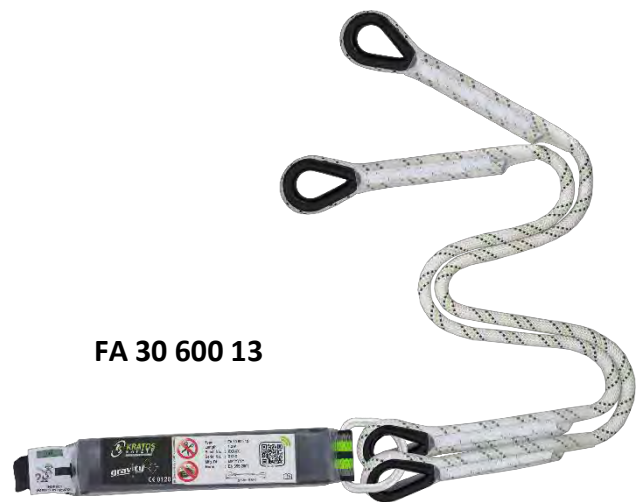
FA 30 600 13