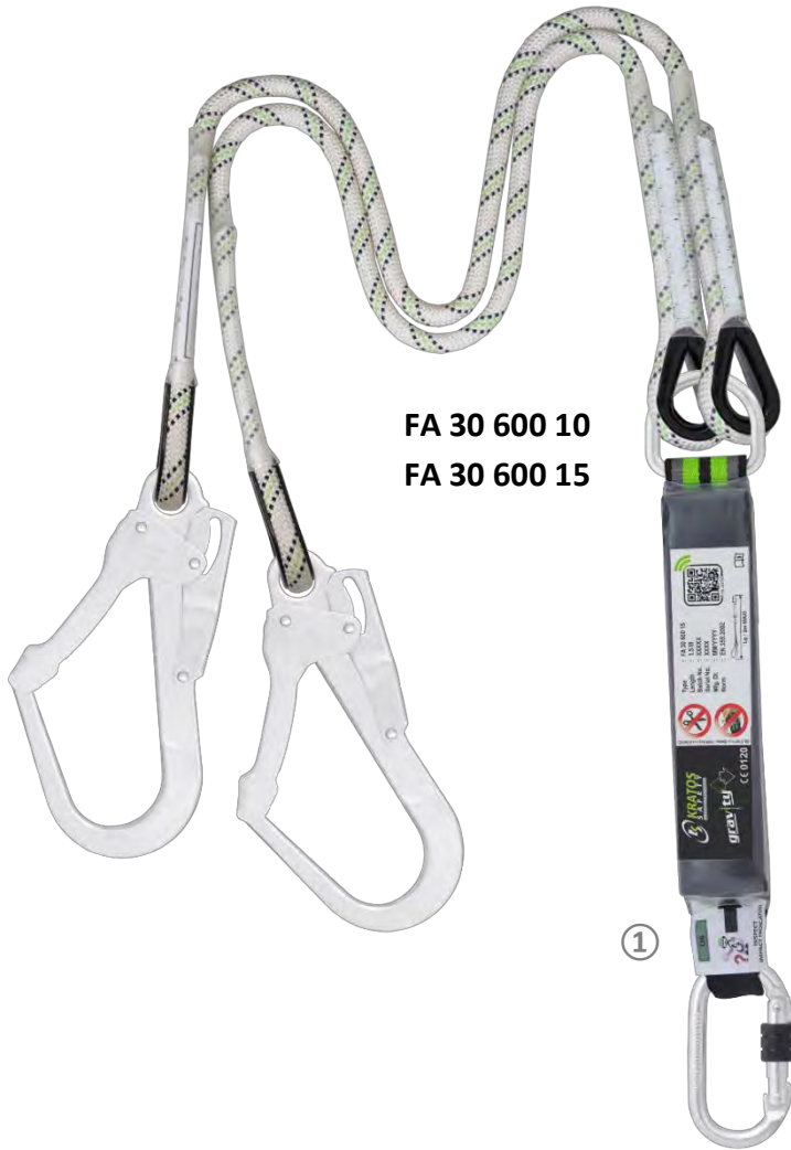
FA 30 600 10 FA 30 600 15